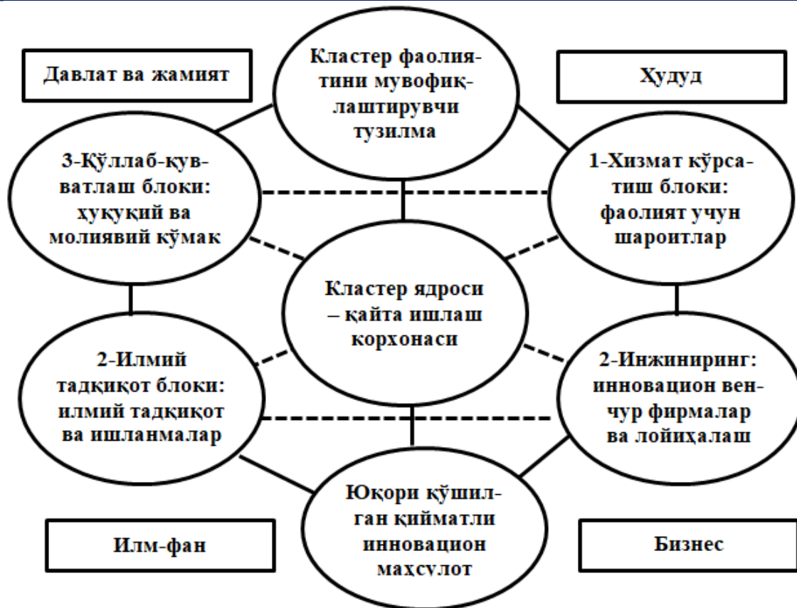
1-расм. Кластер тизимида ташқи муҳит тузилмалари