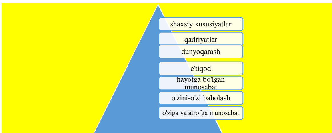
1-rasm. Suisid asosidagi psixologik omillar.

A.Ambrumova tomonidan “Suisid bu – shaxsning ijtimoiy va psixologik jihatdan o’zi boshidan kechirayotgan mikroijtimoiy kelishmovchiliklarga moslasha olmasligi” deb ta’riflanadi [4] 4 .