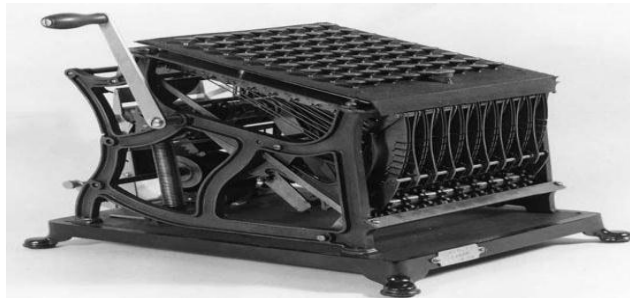
1-rasm Paskal mashinasi (Paskalina)